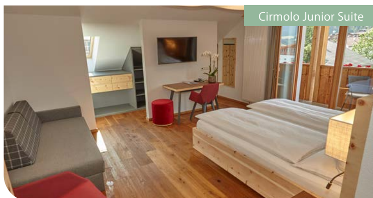
Cirmolo Junior Suite